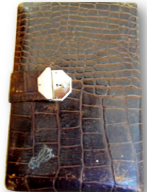
היומן והפרידה הכואבת. קובל 16.6.1927