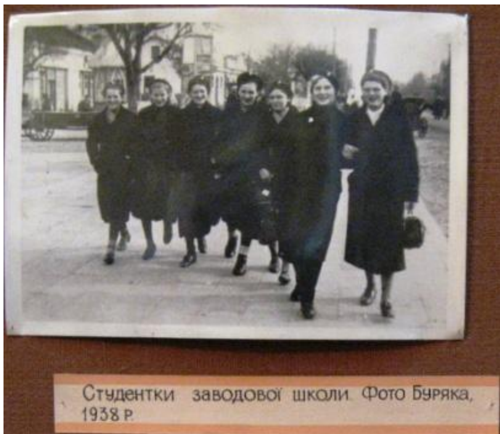
סטודנטים לבית ספר לצילום של פוטו בורק בקובל 1938