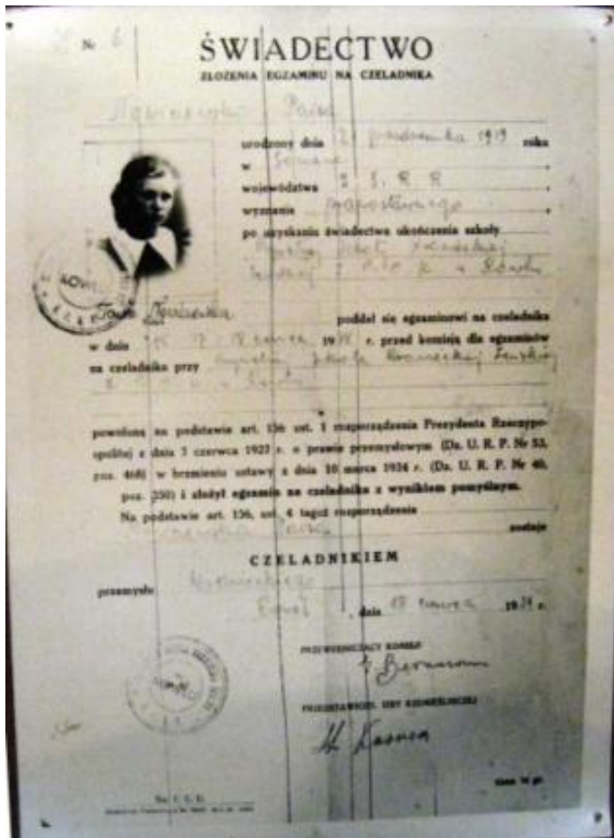
תעודת הסמכה לשוליה