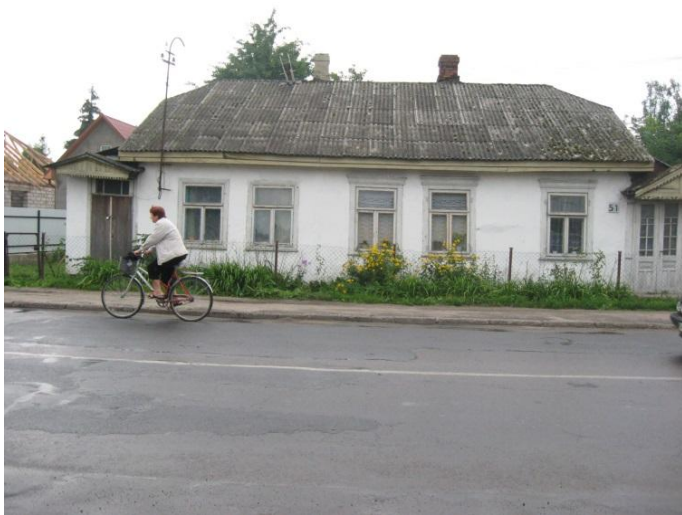
בית אופייני ברחוב וולדמירסקה.