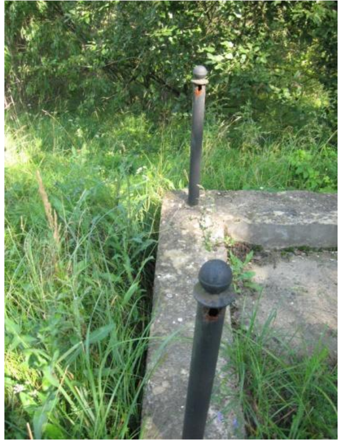
השרשת ששימשה תיחום בין האנדרטה לצמחיית הפרא נעקרה מהעמודים ונגנבה. נזק נגרם לעמודים