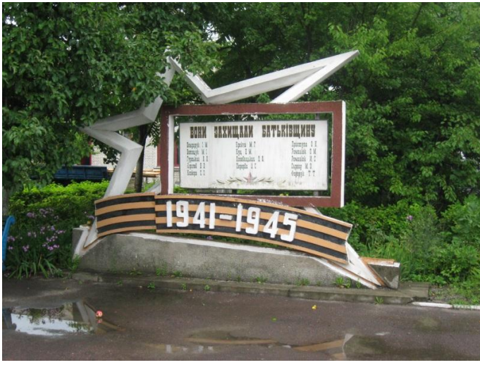
אנדרטה לקורבנות המלחמה מימי הכיבוש הסובייטי. אנדרטה ליד מבדוק הרכבות שבקובל השנייה.