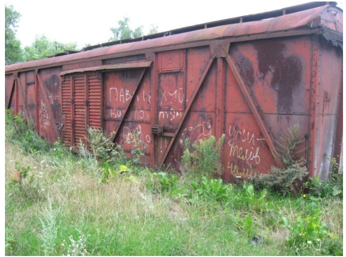
קרונ במתחם לזכר המלחמה. רחוב לוצקה, ליד בית הקברות הנוצרי.