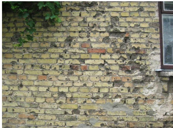
סימני קליעי הרובים עדיין על הלבנים