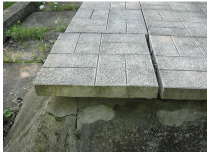
עקירת הצומח בתוך האנדרטה, תיקני טיח וסתימת החריצים בבטון ובין האריחים.