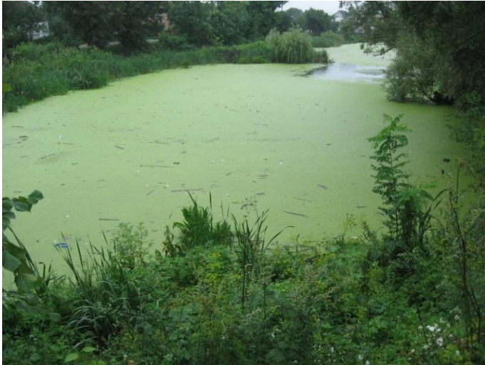
פלג נהר הטוריה הסובב את העיר העתיקה חסום והופך בימות הקיץ לביצה.