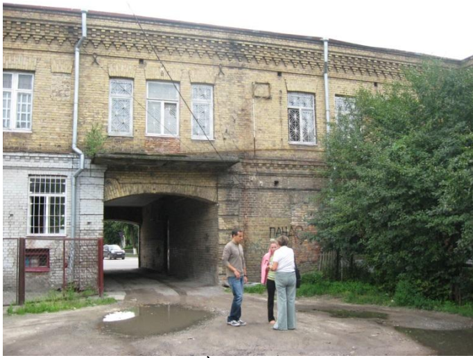
סימה שיכמן, בנה ואחייניתה דנה בלופשטיין