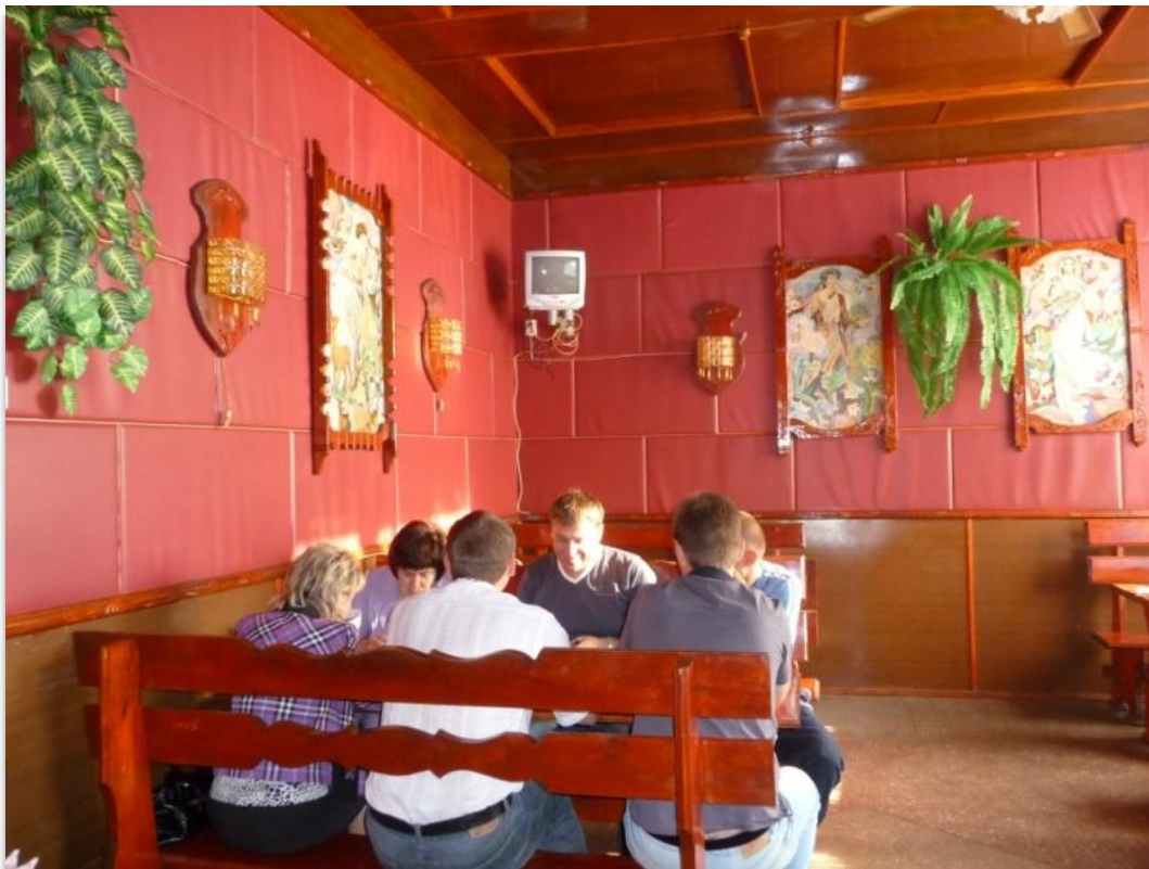
מסעדה מקומית נחשבת וצבעונית