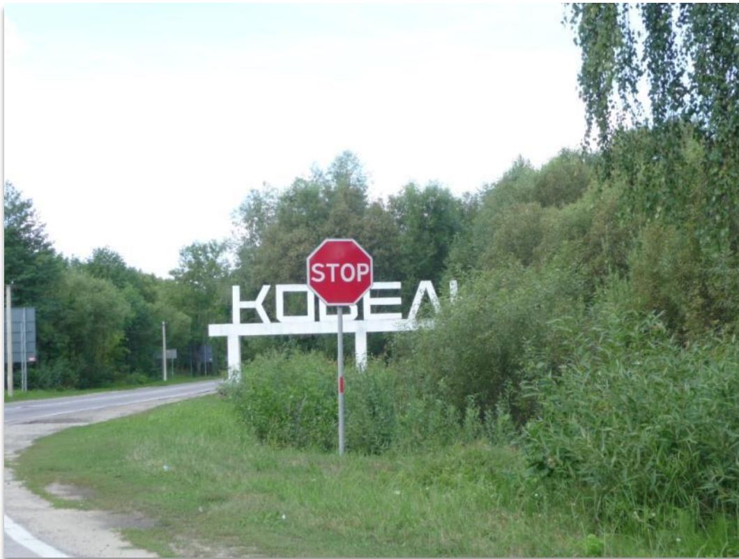
הכניסה לקובל מכיוון דרום (כיוון העיר לבוב)