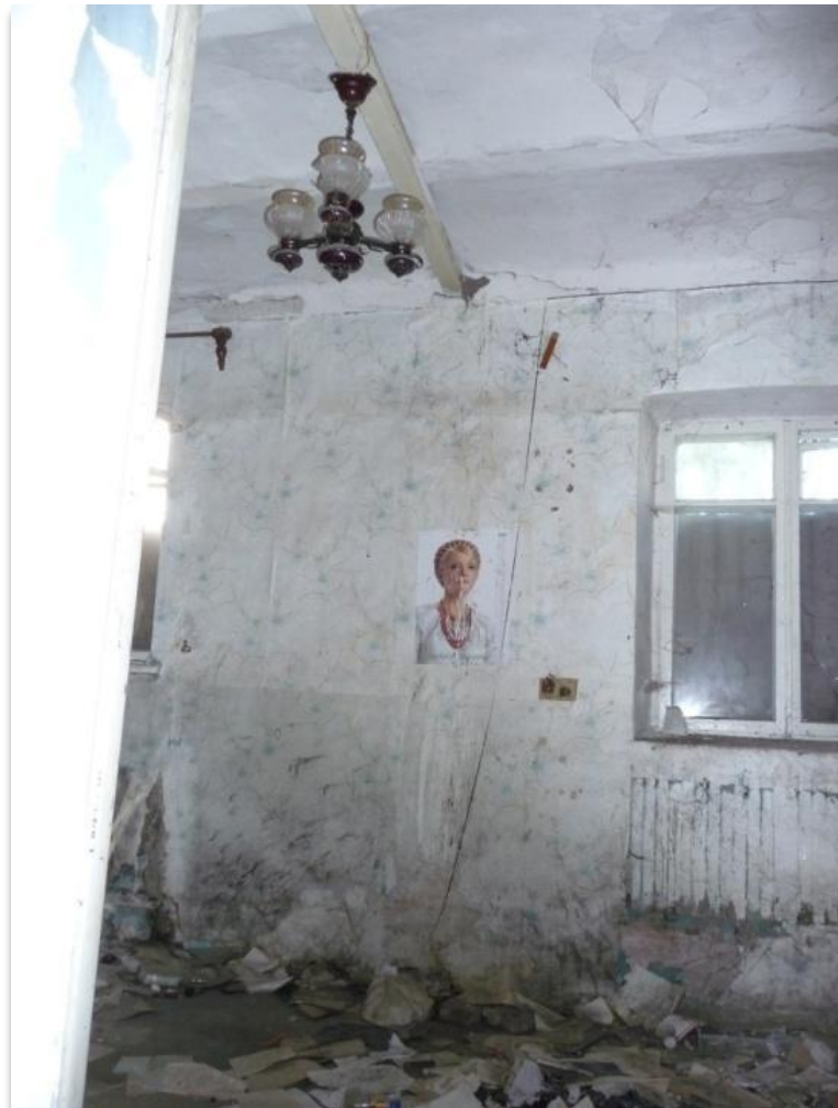
פנים מבנה המקווה הנטוש. על הקיר תמונת המועמדת לנשיאות אוקראינה