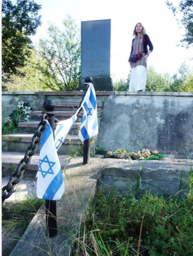
האנדרטה בבכובה (השרשראות המקיפות את האנדרטה נגנבו)