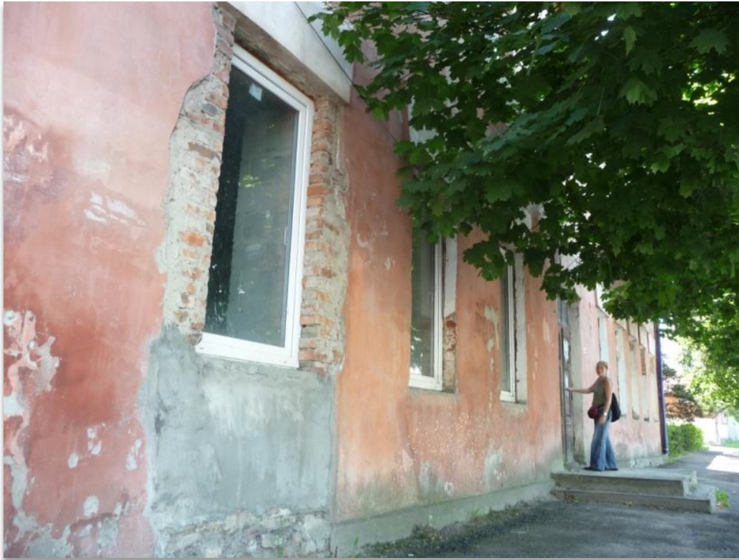
הכניסה לגימנסיה קלרה ארליך. גם היום משמש המקום כמין בית ספר