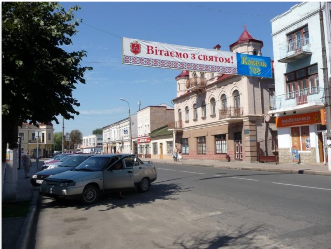
מרכז העיר החדשה. לקראת חגיגות 700 שנה לעיר קובל