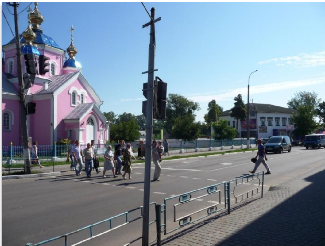
מרכז העיר העתיקה. הכנסייה הפרבוסלאבית הקיימת עוד מהימים ההם. הכנסייה נבנתה משטח שהולאם ממשפחת מוטיוק. בהמשך ניצב בית מוטיוק.