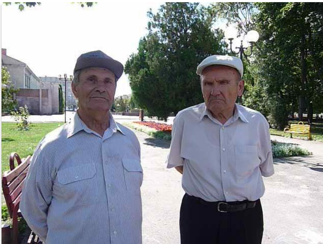
יהודים במרכז העיר. שנת 2010 - פחות ממניין יהודים חיים בעיר