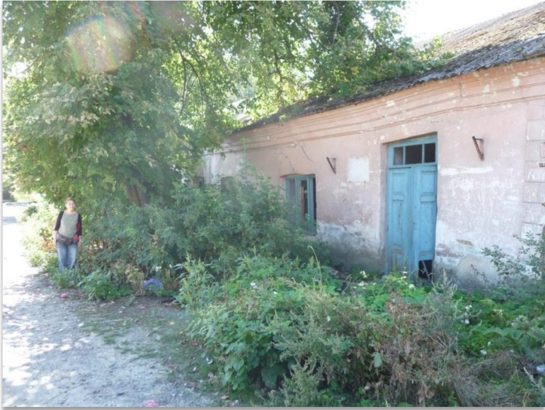
המקווה שליד בית הכנסת הגדול. בשנות החמישים עדיין שימש כבית מרחץ. המבנה היום נטוש, רעוע ומיועד להריסה.