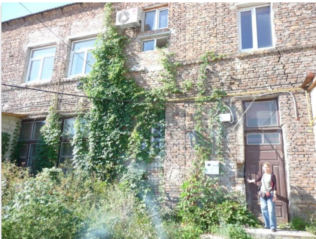
צדו השני, האוטנטי, של בית מוטיוק, בו היתה ממוקם בית המרקחת