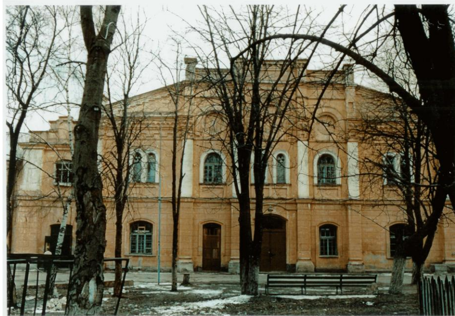
בית הכנסת הגדול של קובל, כפי שהוא נראה כיום

מיבנה שניכר בו כי פעם היה מהודר מאוד, הניצב בעיר העתיקה של קובל, מאכסן כיום מפעל הלבשה אפור. מה רב המרחק בין מה שנעשה בו כיום, לבין תחילת המאה העשרים, כאשר היה זה בית הכנסת הגדול של הקהילה היהודית התוססת בקובל. יתר על כן, מראהו השלו של המיבנה כיום אינו מעיד כלל שהיה זירה לכה הרבה סבל ובסופו של דבר מוות, של מאות ואולי יהודים מעוניים בתקופת השואה.