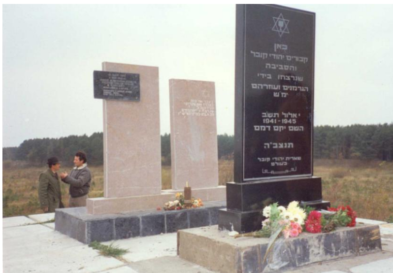
מצבות הזיכרון לקדושי קובל בגיא ההריגה ליד בנובה

הגרמנים החליטו לשכן בגיטו של "החולות" רק אנשים "מועילים", כגון בעלי מלאכה שייצרו מוצרים שונים עבור הצבא הגרמני, בעוד ששאר היהודים, שהוגדרו כ"בלתי מועילים", רוכזו בגטו שבעיר הישנה. מלכתחילה התכוונו הגרמנים לחסל את כל היהודים "הבלתי מועילים" הללו בשלב הראשון של חיסול יהודי קובל.