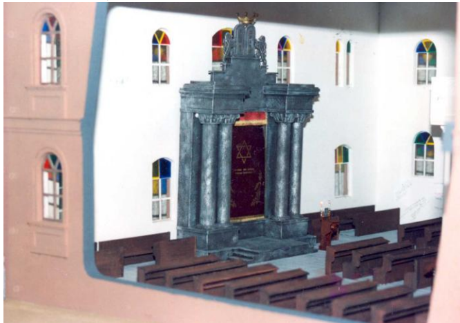
דגם של בית הכנסת הגדול בקובל מימי זוהרו. למעלה – ארון הקודש. למטה - הבימה

וזקנים, גברים ונשים, זרמו אליו כדי ליהנות מנעימותיו המתוקות של החזן המפורסם אהר'לה פיינטוך, שהשמיע אותן בליווי מקהלה. " כך תיאר את בית הכנסת יצחק ולדמן, ב"ספר קובל". הבניין היה אחד מהגדולים בעיר ולכן הוא שימש גם לאירועים ציבוריים שבהם התכנס קהל גדול.